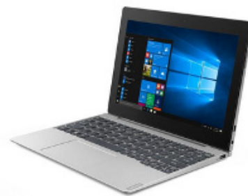
Figura 3: Notebook de gama media