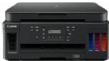
Figura 2: Impresora multifuncional